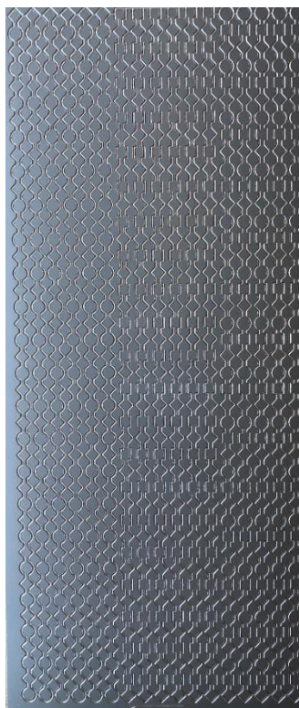
13 Bordüre 1