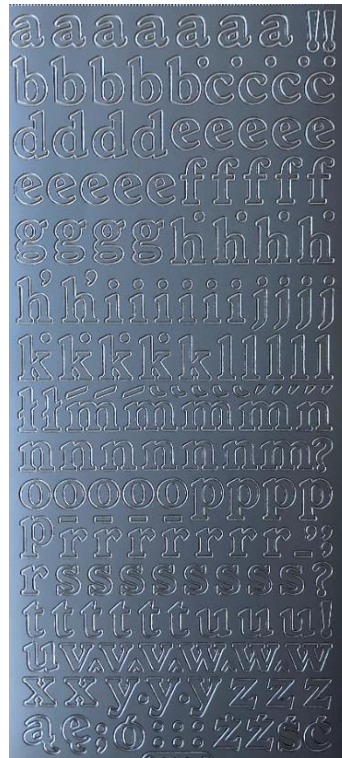
17 Buchstaben klein