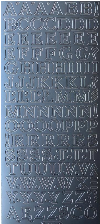
16 Buchstaben groß