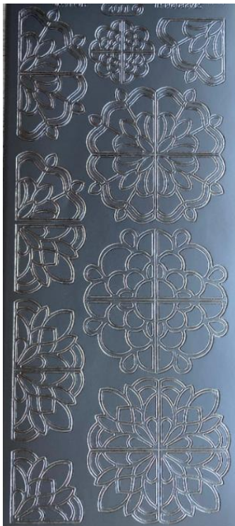
19 Ornamente 1