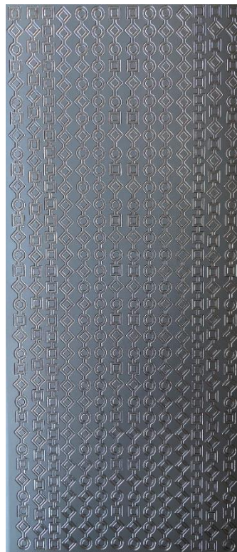
14 Bordüre 2