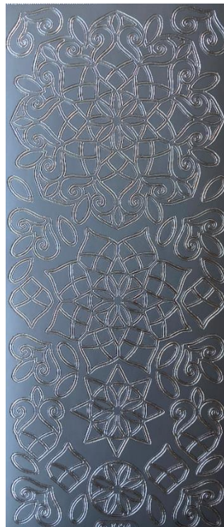
20 Ornamente 2